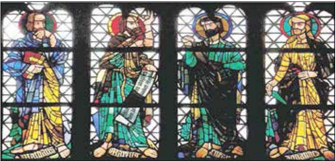
Wo befindet sich dieses Glasfenster und was stellt es dar?