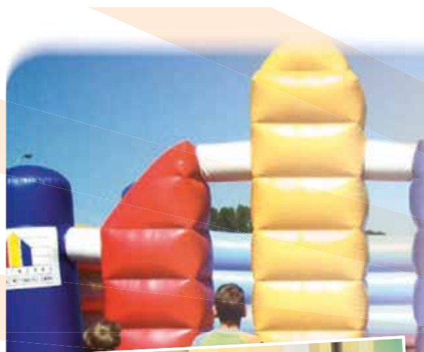
WIR VOM LERCHENBERG