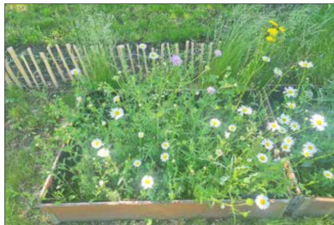
Kleine Blühwiese im Kasten

Diese Wettbewerbsrunde läuft noch bis zum 30.06.2023.