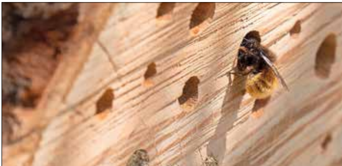
Nisthilfe für Bienen

Um möglichst viele Insekten anzulocken und beobachten zu können, empfiehlt es sich, eine Blühwiese mit vielen verschiedenen heimischen Blumen anzulegen. Schauen Sie doch bei unserem Ratgeber zum Thema Blühwiese www.wittenberg-naturnah.de/massnahmen vorbei, um sich dort Inspirationen zu holen.